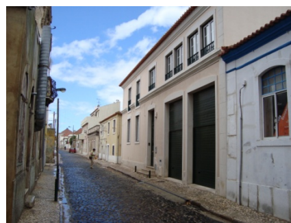
Rua Conselheiro Joaquim António de Aguiar 335 2830-333 BARREIRO